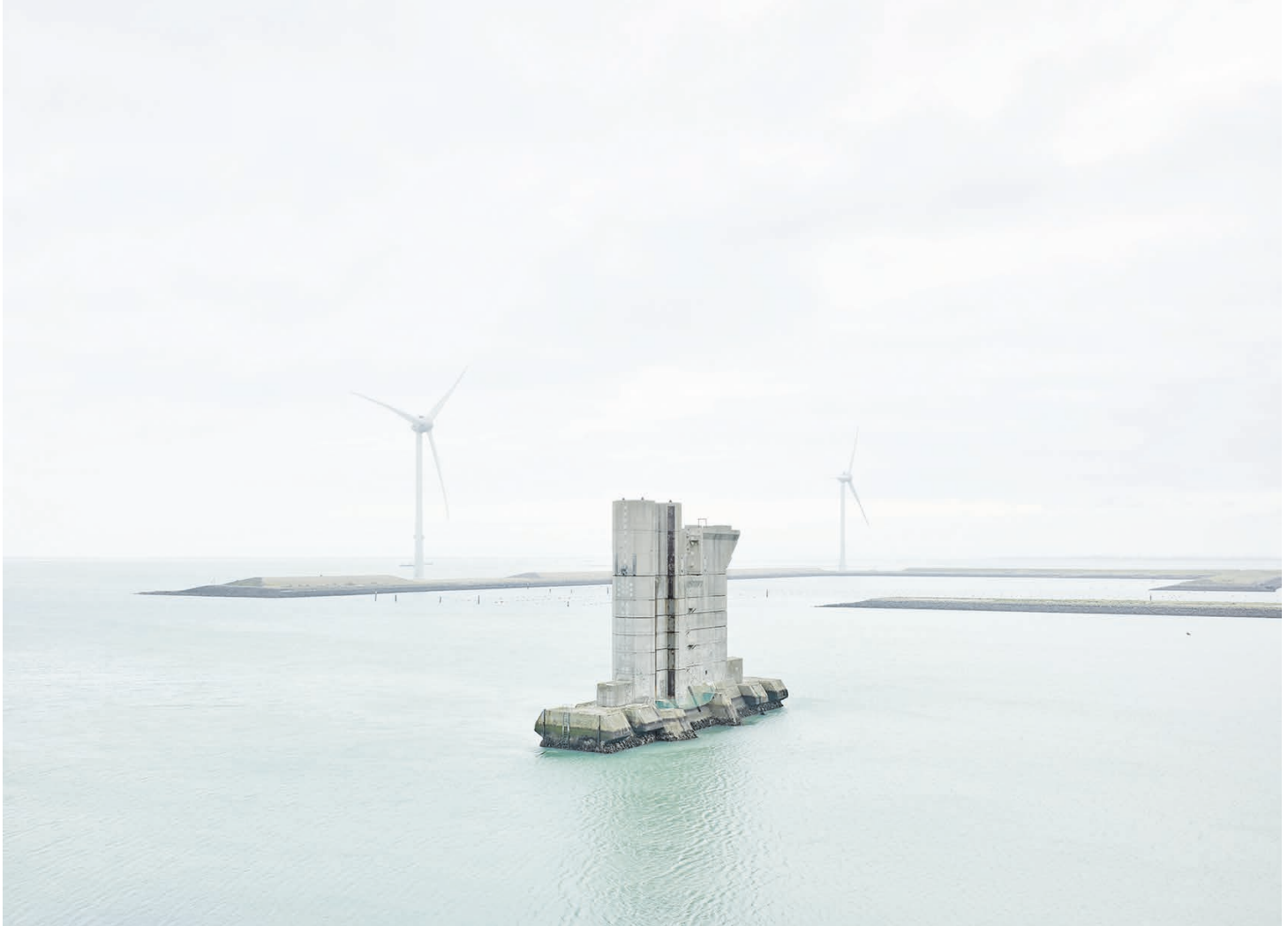
'Pillar', Neeltje Jans.

>> Maar datzelfde, nu door Hofman vereeuwigde landschap, verandert snel. Want Zeeland kampt met verzilting, een proces dat de komende decennia drastisch invloed zal hebben op hoe het land kan worden gebruikt en eruit zal zien.